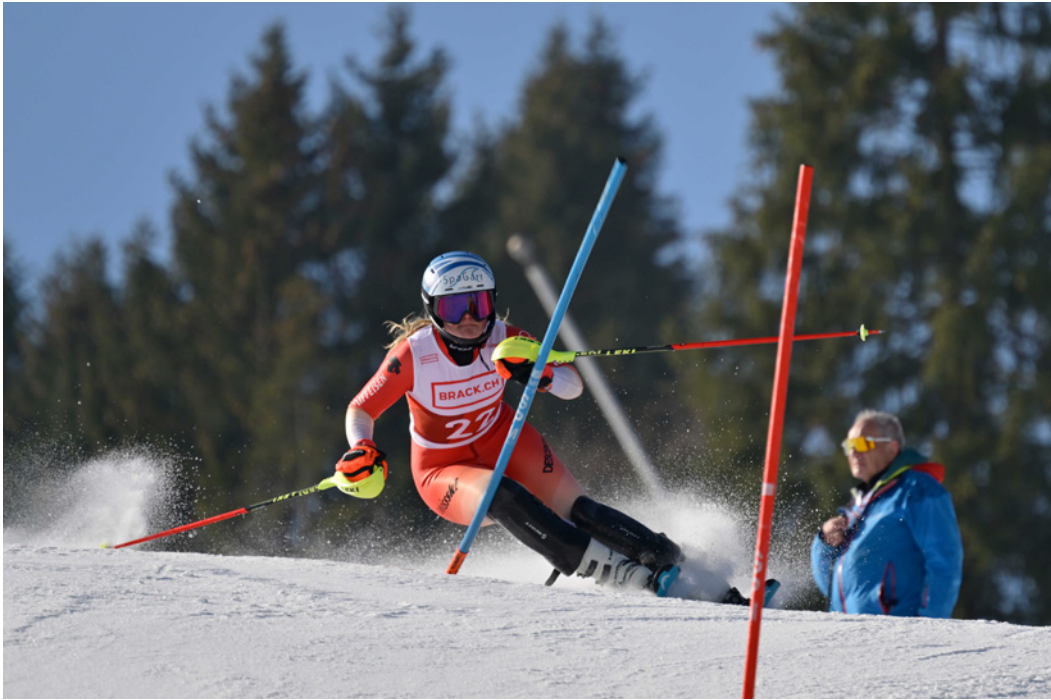
Cheryl in Aktion / Cheryl en action