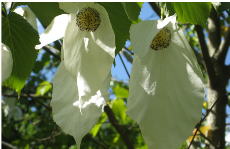
Blüten des Taschentuchbaums / Fleurs de l'arbre à mouchoirs

ein aufrechter, sommergrüner Baum aus China, der bis zu 15 Meter hoch werden kann. Seine auffälligen, weißen Hochblätter erinnern an Taschentücher, diese Blütenblätter hängen im Wind und geben ihm seinen Namen.